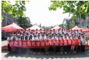
联想专班校园公益活动