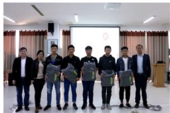
联想技术实训项目答辩