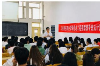
联想专班云计算讲座