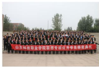
联想奖学金颁奖典礼