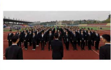
联想班高台演讲主题活动