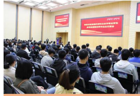
优秀毕业生见面会