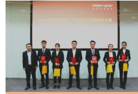
职业生涯规划大赛